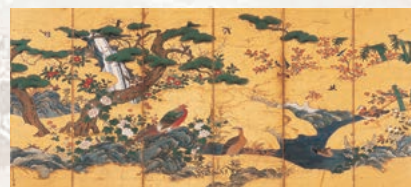
重要文化財「四季花鳥図屏風」(左隻)狩野元信筆 室町時代 展示期間 11/17(日)～12/8(日)