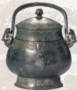
「四弁花文帯缶」 殷時代

なお、開館60周年記念事業により建てられた新館では、「中東絨毯の美 — アナトリア編」と題して、アナトリア絨毯20点を展示します。合わせてご覧ください。