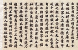
国宝「賢愚経」甲巻 奈良時代 展示期間 9/25(水)～10/14(月)