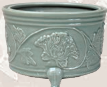
「青磁浮牡丹文香炉」 南宋時代